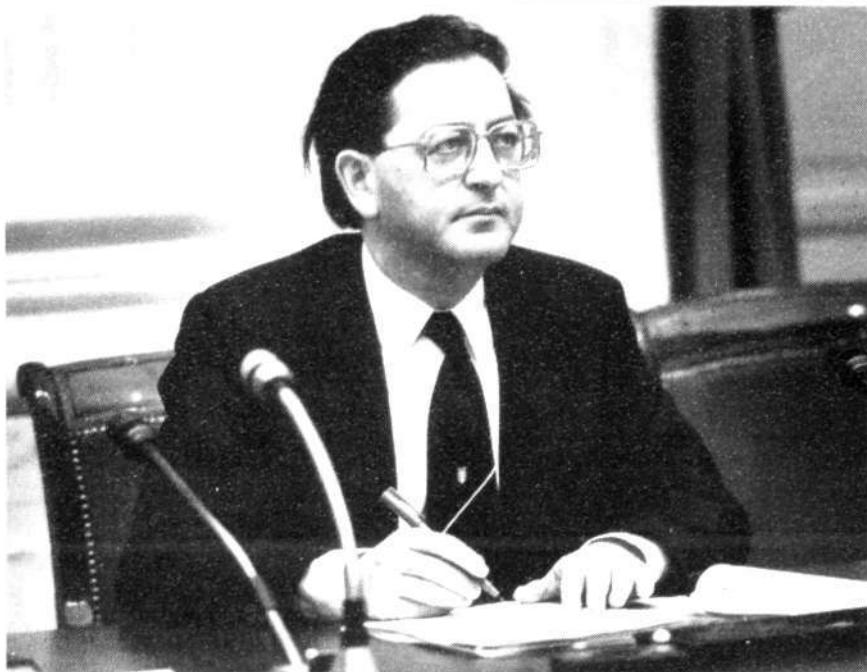
Minister Pais van Onderwijs en Wetenschappen

zocht naar mogelijkheden om – zo lang de harmonisatie nog niet tot stand was gekomen – de VUT-regeling voor het exploitatiepersoneel van toepassing te doen zijn. Deze opmerkingen maakte de Minister op 22 november 1979. Ik verwijs daarvoor naar blz. 462 van de Handelingen van die datum.