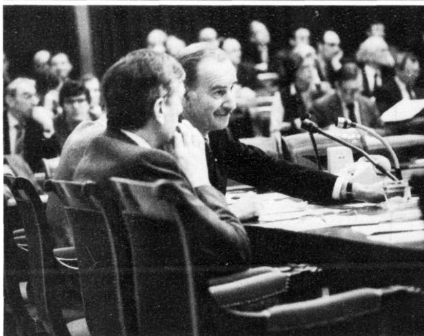
De Ministers De Geus (Defensie) en Van der Klaauw (Buitenlandse Zaken) tijdens de stemmingen over hun begrotingen

de motie-Aarts c.s. over handhaving van de huidige ODA-inspanning (16 400-V, nr. 37);