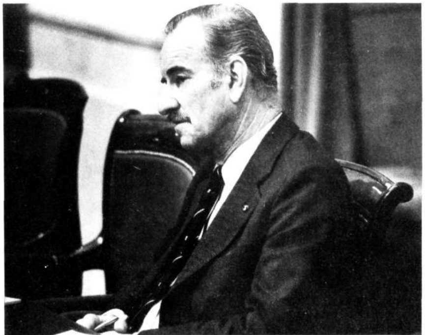
Minister Van der Klaauw (Buitenlandse Zaken)

De heer Scholten (CDA): Mijnheer de Voorzitter! Zuidelijk Afrika wordt in zijn politieke en sociaal-economische stabiliteit bedreigd vanwege de interne politiek in Zuid-Afrika en vanwege het beleid dat dit land voert ten aanzien van Namibië. Tot dusver zijn in