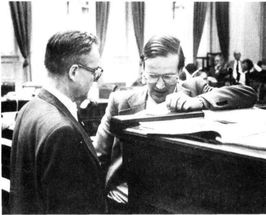
Minister Scholten (Defensie) en de heer Patijn (PvdA) (r)

De Voorzitter : Ik constateer, dat de aanwezige leden van de fracties van de PSP, de PPR en de CPN vóór deze motie hebben gestemd en dat thans de fracties van de BP en het GPV afwezig zijn.