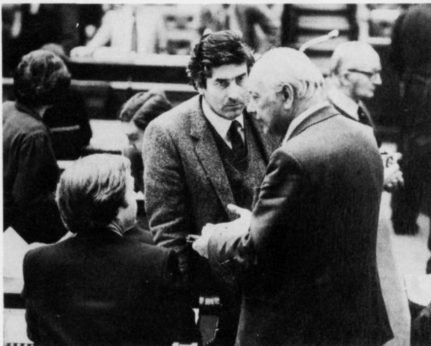
Overleg tussen de fractievoorzitters Terlouw (D'66) (l), Lubbers (CDA) (m) en Den Uyl (PvdA) (r)

De motie van de heer Nijpels heeft deze zaak iets verzacht. Daarin is ook iets minder duidelijk gesteld of personeel wel of niet aanwezig zou moeten zijn. Er is een ontwikkeling gaande waarbij de contacten tussen de BM en de verschillende inrichtingen groeiende zijn. Ik vind dit zeer positief. Het is ook goed. Ik laat echter graag aan de directeurs de verantwoordelijkheid om te bezien in hoeverre binnen de orde in het huis daartoe mogelijkheden zijn. Ik zal proberen deze te bevorderen. Ik kan leven met de motie van de heer Nijpels, hoewel ook deze motie langs de kanten van de mogelijkheden gaan die ik in de huizen meen te moeten geven.