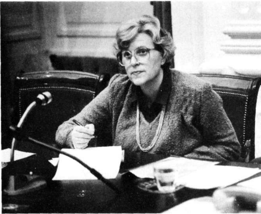
Staatssecretaris mevrouw Kraaijeveld-Wouters

de advisering inzake emancipatievraagstukken (15 800-XVI, nr. 16); het verslag van mondeling overleg over het ontwerp-bijstandsbesluit landelijke draagkrachtcriteria (15 300-XVI, nr. 76).