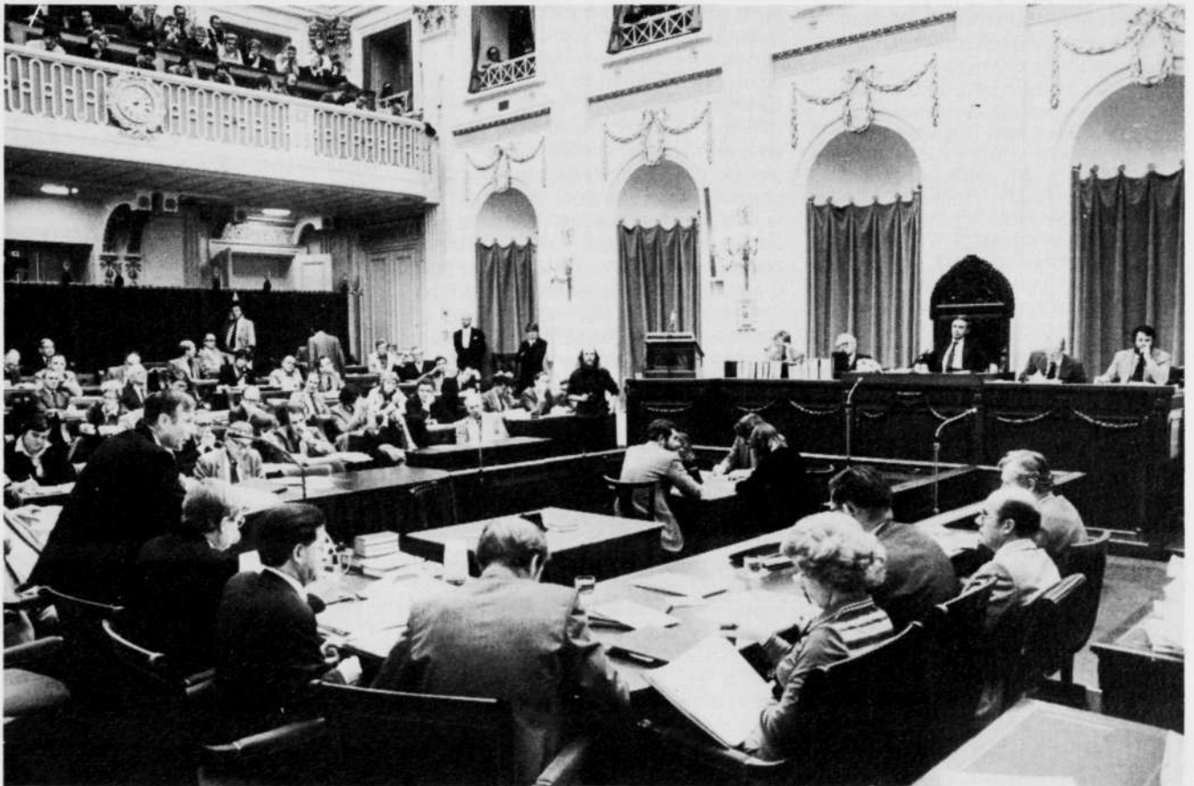
Voortzetting van de algemene politieke en financiële beschouwingen over de rijksbegroting voor 1981. Minister-President Van Agt heeft het woord

Een tweede opmerking in de voetnoot van de geachte afgevaardigde de heer Den Uyl betreft de ontwikkeling van de werkloosheid in wat ik huishoudelijk noem 'zijn kabinetsperiode'. Hij noemt daarvoor als basisjaar 1974. De werkloosheid was toen op 143.000 ge-